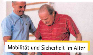
Mobilität und Sicherheit im Alter

Mobilität und Sicherheit im Alter MoSi® – Unser spezielles Gruppenangebot für Senioren MoSi® ist ein 5-wöchiges Trainings- Et Präventionsprogramm zur Erhaltung und Verbesserung der Gangsicherheit (Mobilität), des Gleichgewichts, der Koordination, der Reaktion und der Sicherheit im Alltag sowie der Prävention von Stürzen für Menschen ab dem 65. Lebensjahr.